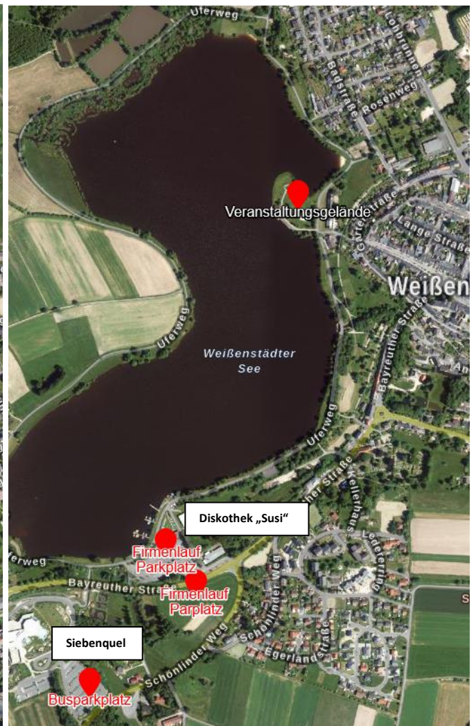
Busparkplatz am Siebenquell

Während der Anreisephase ist mit sehr hohem Verkehrsaufkommen und Staus in Weißenstadt zu rechnen. Bitte bildet Fahrgemeinschaften, um die Verkehrssituation zu entlasten oder verzichtet nach Möglichkeit bei der Anreise auf das Auto.