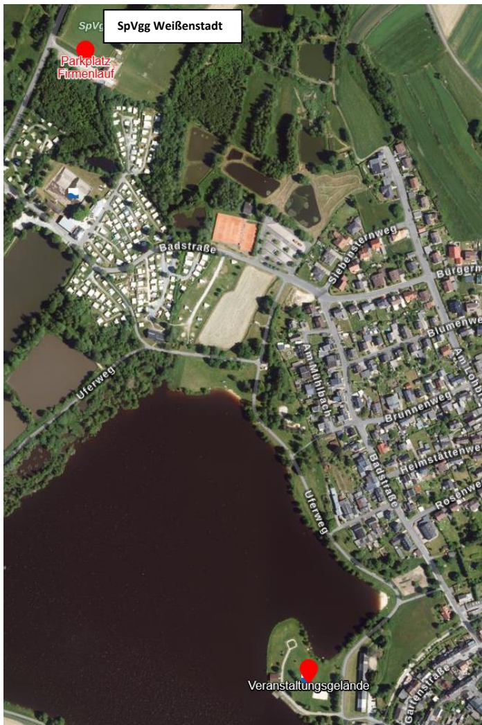
Parkplatz an der SpVgg Weißenstadt